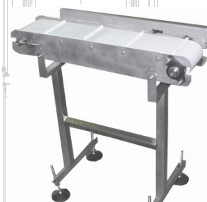
Gurtförderer mit Mitnehmer

Die hier aufgeführten Maschinen stellen nur einen Auszug aus unserem Leistungskatalog dar.